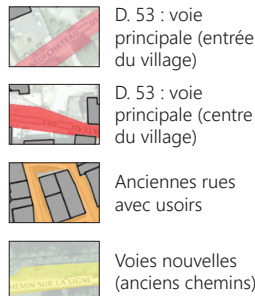
Schéma : étude CAUE de 2016 (Jérôme MARQUIS, paysagiste concepteur chargé d'études)