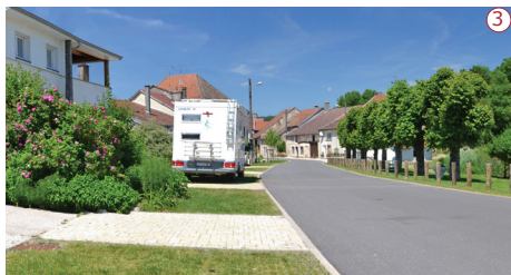
2021 | La rue du Pont après aménagement