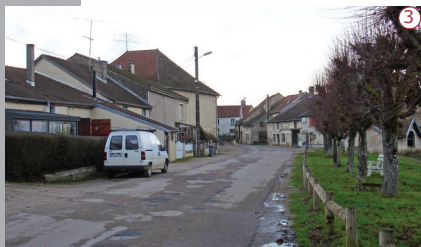
2016 | La rue du Pont : l'emprise importante de la chaussée