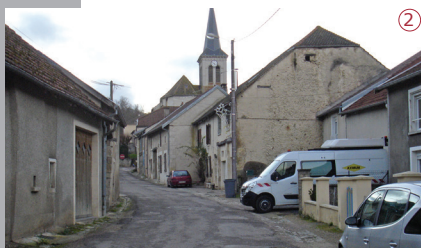
2016 | La Grande Rue : une voie en pente très étroite