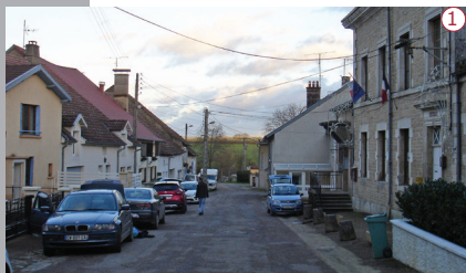
2016 | La rue de la Mairie