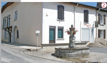
2015 | La fontaine ronde et les abords de la boulangerie