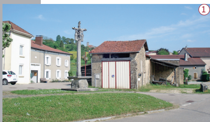
2015 | La place des Halles et la croix classée du 16 e siècle