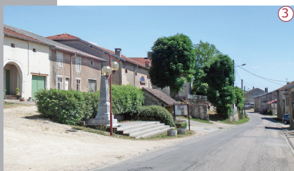
2015 | Le monument aux morts et la fontaine couverte